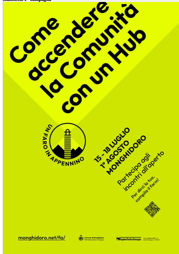
Manifesto 1^ campagna