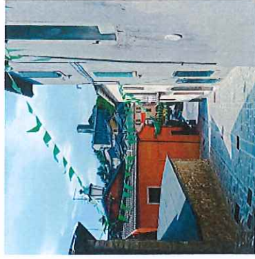
Comune di MONTECRETO Prot.n.0005470 del 17-11-2024 in arrivo