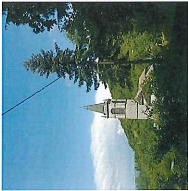
Comune di MONTECRETO Prot.n.0005470 del 17-11-2024 in arrivo

Il latte a Montecreto era quello delle pecore che pascolavano anche nel centro del paese.